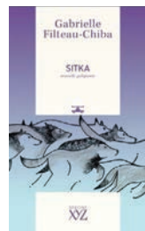
SITKA Gabrielle Filteau-Chiba