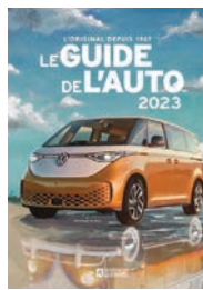
LE GUIDE DE L'AUTO 2023