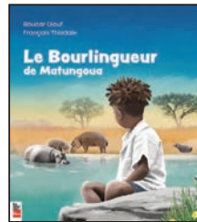
LE BOURLINGUEUR DE MATUNGOUA Boucar Diouf